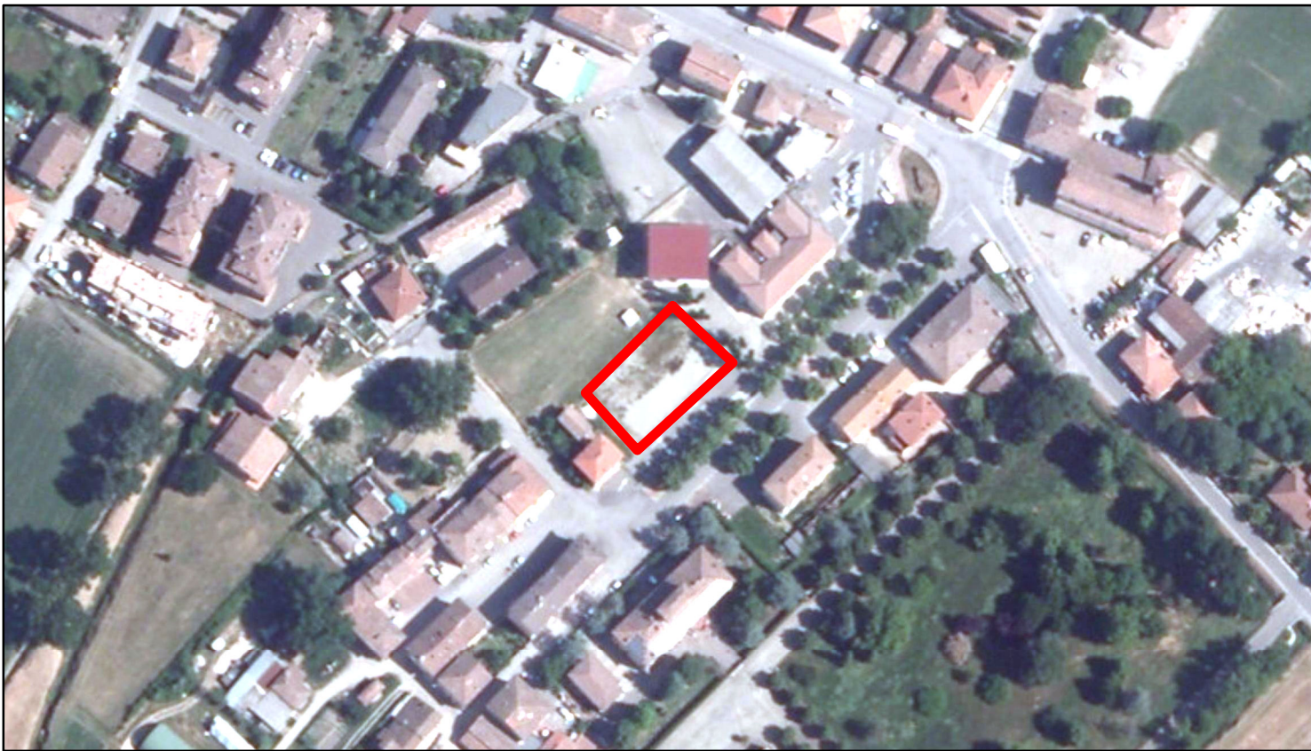
estratto ortofoto - Aea 2011 sc. 1:2000